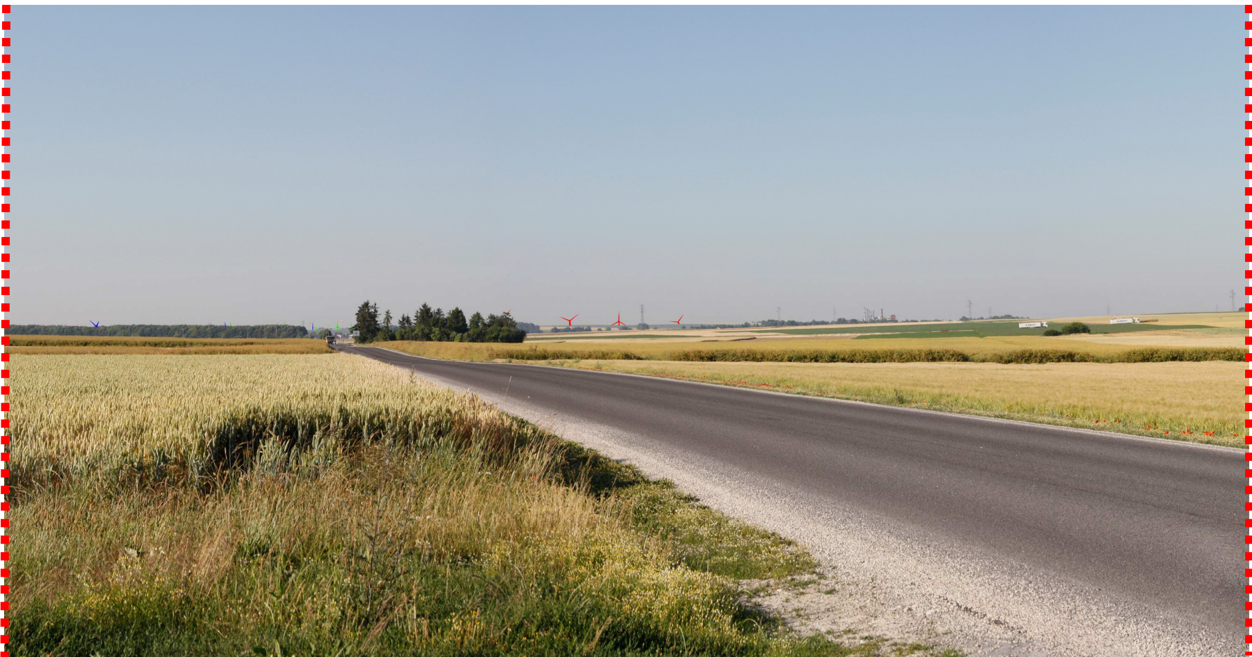
Photomontage d'interprétation recadré à 60°