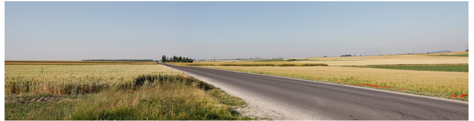
Le site actuel